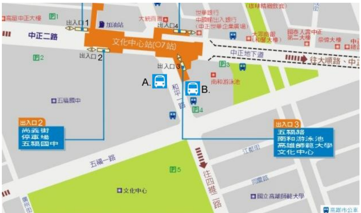
附圖二：文化中心站捷運平面圖